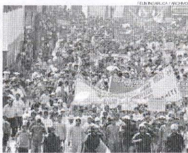
MANIPULADOS. La gran mayoría de limeños y chalacos considera que las protestas sociales responden a una manipulación política.